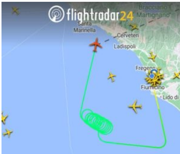
La manovra d'emergenza del volo poco prima dell'atterraggio

Secondo quanto riportato, l'aereo ha seguito le normali procedure di "emergenza verde" , iniziando ad inanellare diversi giri sul mare, per scaricare parte del carburante, riducendo così il peso per facilitare un atterraggio più sicuro. Dopo circa un'ora, l'aereo è regolarmente atterrato, alle 11:06.