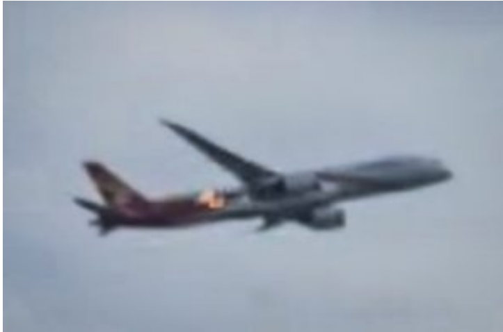
Le fiamme visibili dal motore dell'aereo

Secondo quanto riportato, l'aereo ha seguito le normali procedure di "emergenza verde" , iniziando ad inanellare diversi giri sul mare, per scaricare parte del carburante, riducendo così il peso per facilitare un atterraggio più sicuro. Dopo circa un'ora, l'aereo è regolarmente atterrato, alle 11:06.