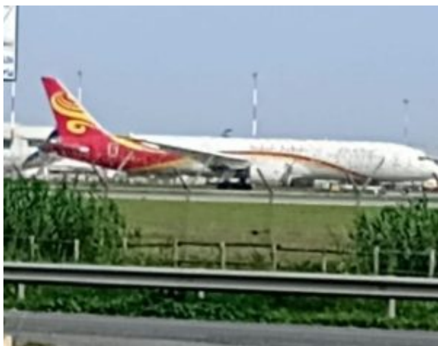
Boeing 787-9 di Hainan Airlines rientrato a Fiumicino